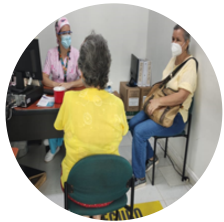
Presencial en la oficina de Atención al Usuario